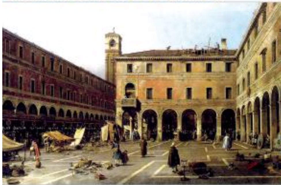
Chiesa dei Santi Giovanni e Paolo con la scuola di San Marco, Cremona 1715, Gemäldegalerie, Dresden

RE-INGEGNERIZZAZIONE DELLA PREVENZIONE INDIVIDUALE E PROGRAMMI DI SCREENING: EFFICACIA, QUALITÀ E SOSTENIBILITÀ